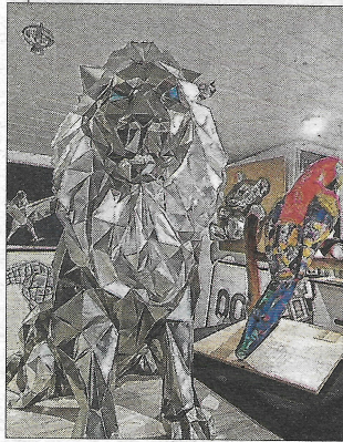
Le lion, majestueux à souhait.